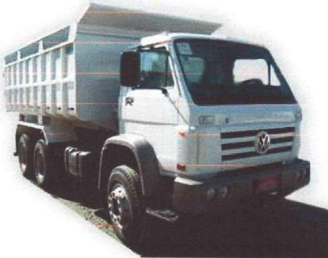
(Ilustração de caminhão com caçamba metálica)

Os veículos utilizados serão do tipo caminhão basculante, trucado, motor a diesel, min. 230cv, equipado com caçamba metálica basculante de carga mínima de 10m 3 .