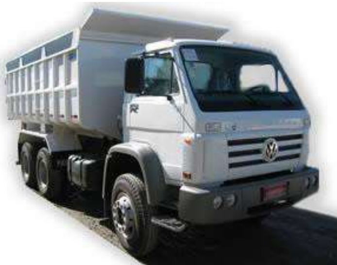
(Ilustração de caminhão com caçamba metálica)

Abaixo está o quadro resumo das vicinais, contendo suas extensões e larguras, quedaron suporte ao levantamento dos quantitativos estimados das horas necessárias para a execução dos serviços de escavação de piçarra na jazida e seu transporte até as estradas. Apesar de servir como referencial, o objeto do termo de referência não obriga a execução de recuperação apenas das estradas vicinais constantes na listagem a seguir, tratando-se estas apenas de trechos prioritários, definidos previamente, dentro do contexto atual, pela PMO. Evidentemente, havendo ganho de produtividade que gere disponibilidade de saldo de horas ou caso haja mudança de prioridades por parte da Administração Municipal, outras comunidades poderão ser contempladas, a qualquer tempo, sem prejuízo ao escopo do objeto proposto.